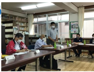
部活動後援会 = 6月10日