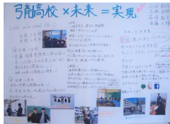
弓削高 P R ポスター