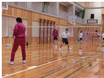
クラスマッチ = 4月