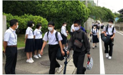
あいさつウィーク = 6月