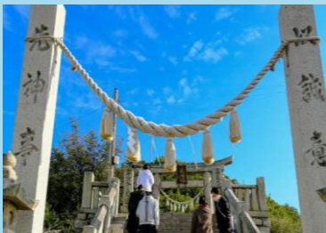
▲デジタルポスター作成時のフィールドワークの様子

村上海賊の拠点のひとつ、岩城島にあった亀山城は、今は神社として島の生活に溶け込んでいます。時代の変遷を物語る史跡を訪れて、島の歴史を学びます。